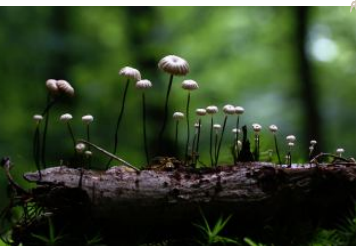
Le congrès des ombrelles

A cette fin elle organise ou participe à toute action de recherche, d'étude, de conservation, de sensibilisation et de vulgarisation relative à la faune, à la flore, à la biodiversité du patrimoine naturel matériel et immatériel.